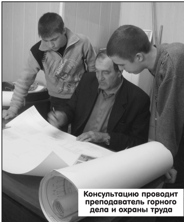
Консультацию проводит преподаватель горного дела и охраны труда

Принципы работы горно-шахтного оборудования студенты узнают не из учебников, а в современно оснащенных лабораториях и учебных классах. Мультимедийное обеспечение, учебно-методические комплексы «Виртуальная